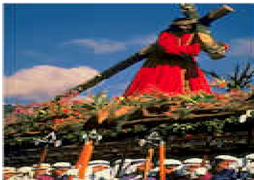
Procesión de la hermandad de la iglesia de la Merced en Antigua Guatemala

En cada ocasión es de diferente aldea y recorre las principales calles de la ciudad durante varias horas. La Semana Santa da inicio el Domingo de Ramos con gran esplendor. Los días jueves y viernes continúa con gran devoción con motivo de las procesiones de Santo Entierro y concluye el Domingo de Pascua con la celebración de la Resurrección de Cristo.