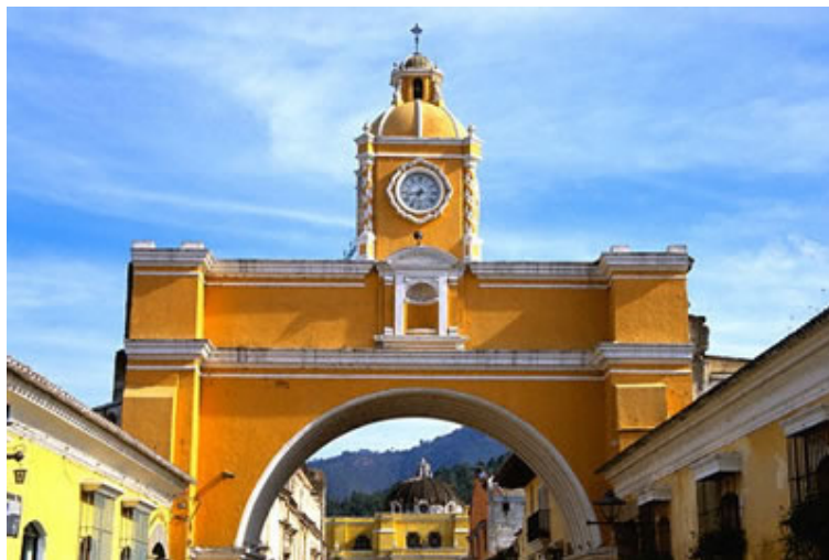
La calle del arco (Antigua Guatemala)

Al ingreso de la ciudad usted empezará a percibir la tranquilidad y nostalgia que transmite esta ciudad. Es recomendable que se aleje del tiempo de su reloj, y empiece a experimentar un nuevo ciclo de vida en el pasado.