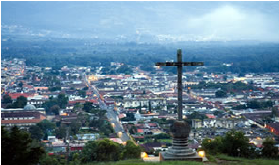
Vista desde el cerro de la cruz, abajo se aprecia la ciudad de Antigua Guatemala

Las siguientes son dos vista de la ciudad de Antigua Guatemala, una amaneciendo y la otra entrando la noche.