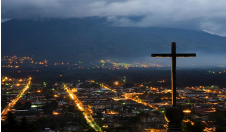
Vista cayendo la tarde de la ciudad colonial Antigua Guatemala (tomada en el cerro de la cruz)