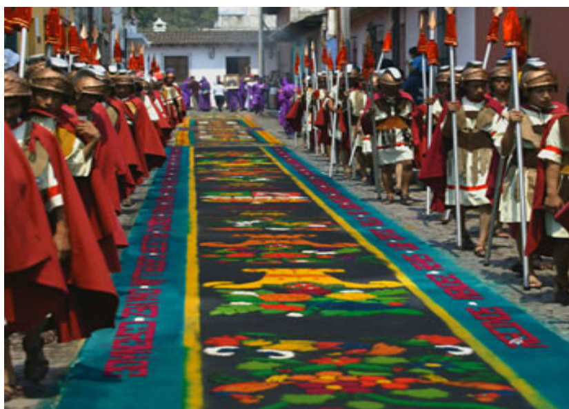
Alfombra de aserrín de colores, con diseños de la época semana santa, al paso de la procesión

Es la expresión más sobresaliente de las tradiciones que caracterizan a la Antigua. Se conmemora la Pasión de Cristo a través de rituales tales como la creación de altares especiales dentro de las iglesias, las procesiones, las velaciones, los Vía Crucis, la elaboración de andas que llevarán las imágenes y las alfombras que adornan las calles en donde pasarán las procesiones.